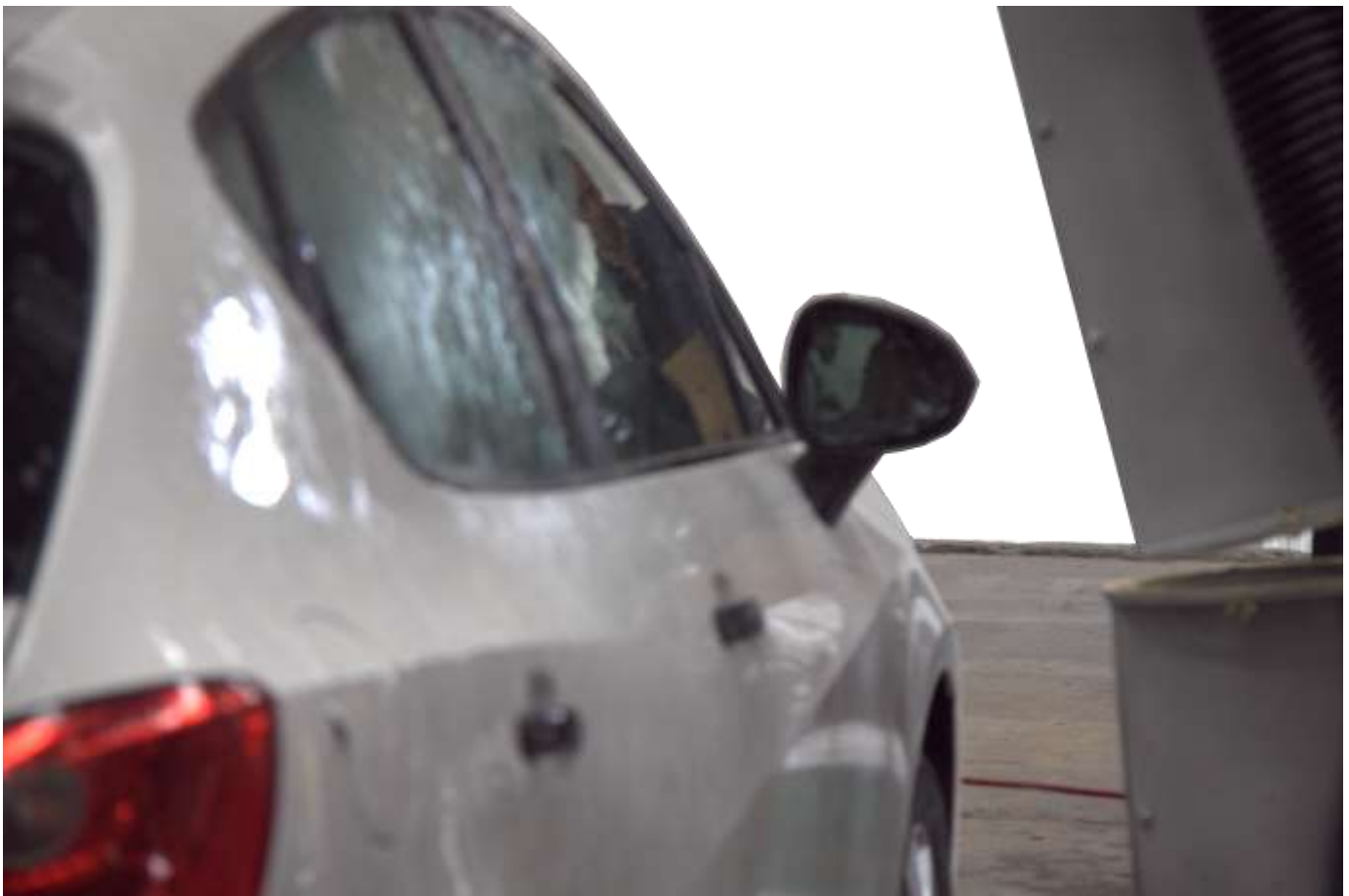
Auto mojado siendo secado por cuchillos de aire

Es recomendable que el producto pase lo más cerca posible del cuchillo de aire y es necesario aumentar la amplitud del cuchillo y la velocidad del chorro conforme se incrementa la separación entre el producto y el difusor de aire.